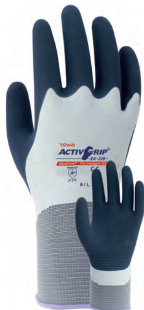
XA326 Total estanqueidad