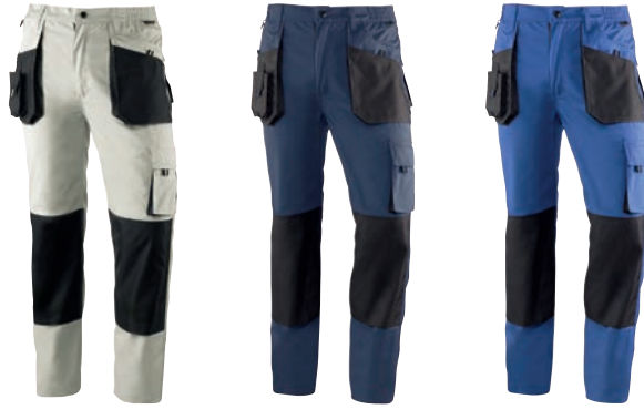
971 Beige-Negro / Bege-Preto