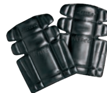
Rodillera R020 Joelheira R020