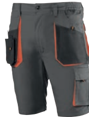
962 Gris oscuro -Negro-Naranja / Cinzeno escuro-Preto-Laranja