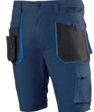
982 Marino-Negro / Azul marinho-Preto