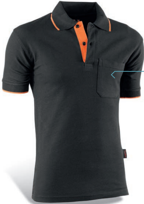
647 Negro-Naranja / Preto-Laranja