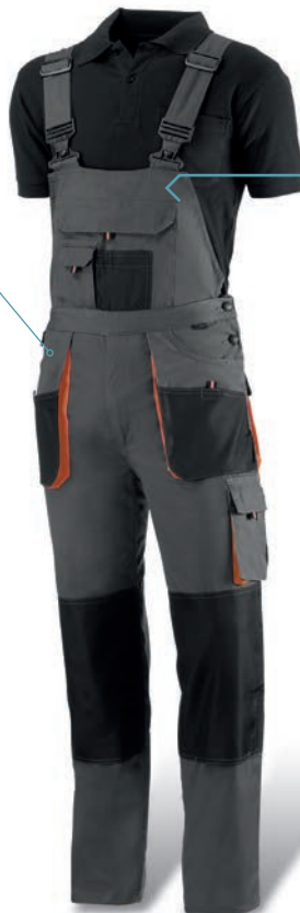
963 Gris oscuro-Negro-Naranja / Cinza escuro-Preto-Laranja