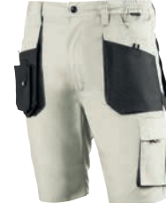
972 Beige-Negro / Bege-Preto