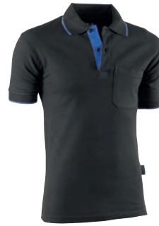
648 Negro-Azulina / Preto-Azulado