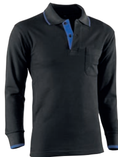
617 Negro-Azulina / Preto-Azulado