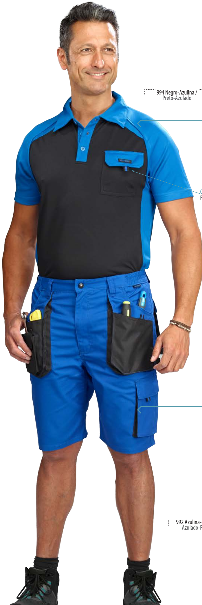
994 Negro-Azulina / Preto-Azulado