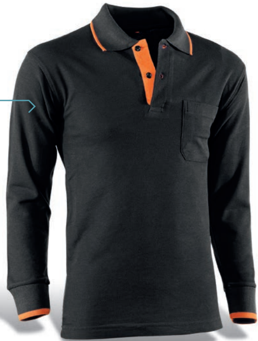
618 Negro-Naranja / Preto-Laranja