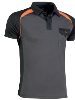
964 Gris-Negro-Naranja / Cinzeno-Preto-Laranja