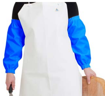
CHAL950A Azul / Azul