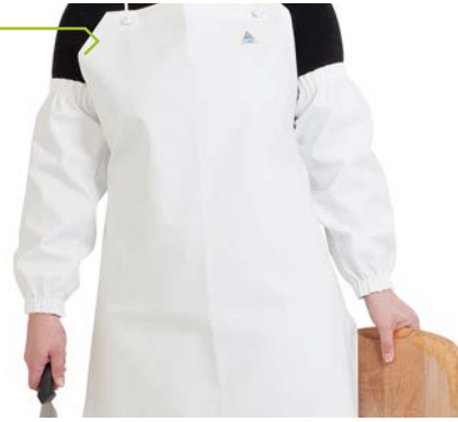
CHEN950B Blanco / Branco