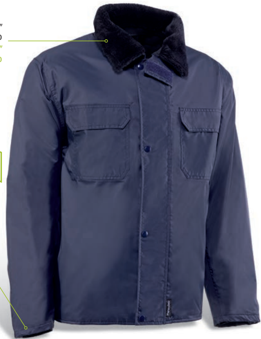
CH322 Azul marino / Azul marinho

Puño elástico interior Punho elástico interior