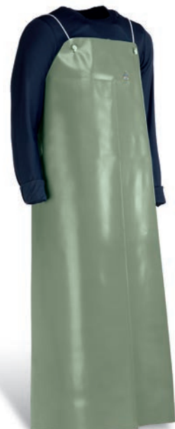
CHEN925V Verde / Verde