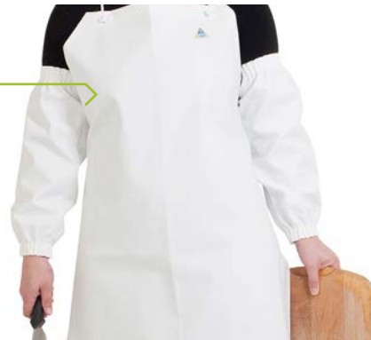
CHAL950B Blanco / Branco