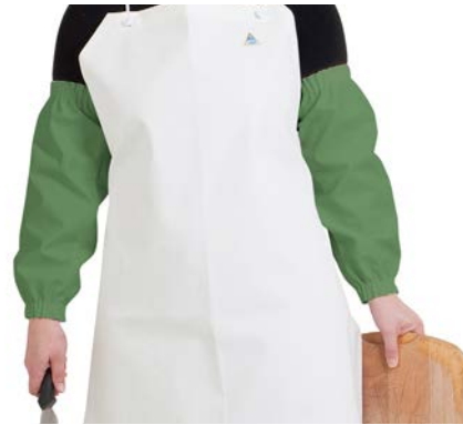
CHEN950V Verde / Verde