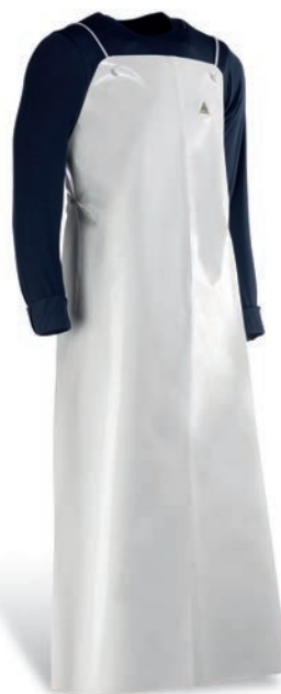
CHEN925B Blanco / Branco