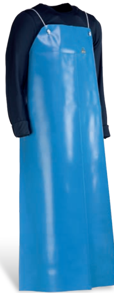
CHFP3935A Azul / Azul