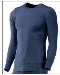
Camiseta interior de regalo T-Shirt interior de presente

FABRICADOS EN ESPAÑA FABRICADAS EM ESPANHA