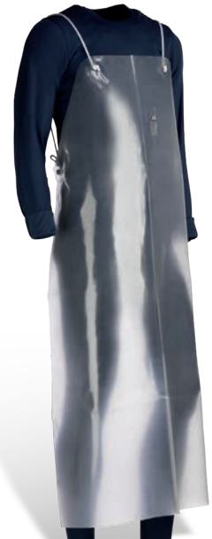
CHFP3935T Transparente / Transparente