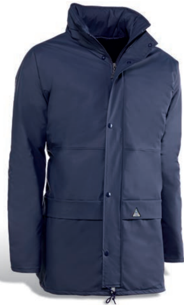
CHPL309 Azul marino / Azul marinho

FABRICADOS EN ESPAÑA FABRICADAS EM ESPANHA