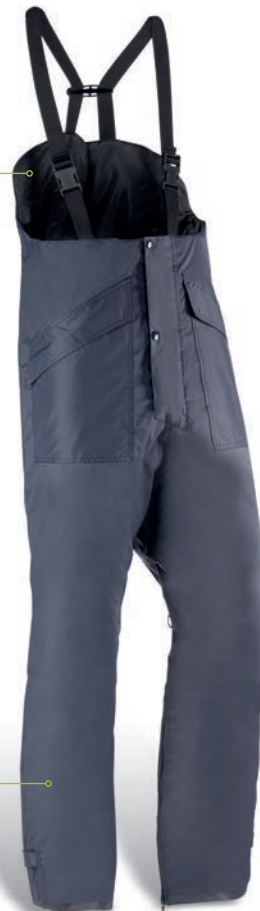
CH225 Azul marino / Azul marinho