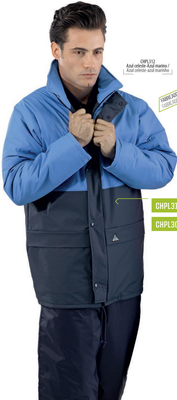
CHPL312 Azul celeste-Azul marino / Azul celeste-azul marinho

FABRICADOS EN ESPAÑA FABRICADAS EM ESPANHA